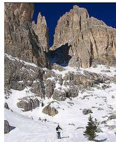
Salita verso i rifugi Vajolet e Preuss

Cartografia Ed. Tabacco 1:25.000 Foglio 06 Val di Fassa