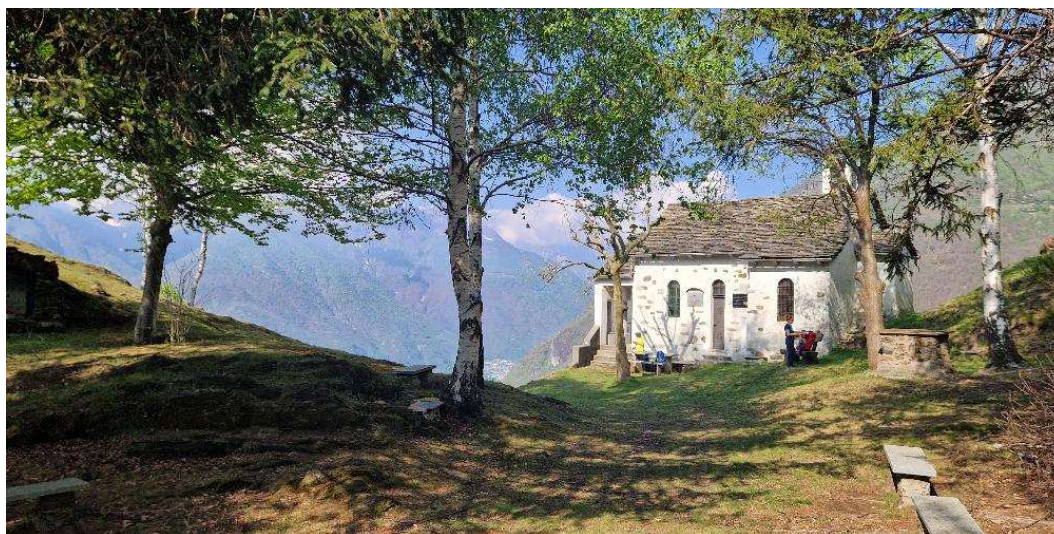
Chiesa dell'Alpe Lut

Il ritorno a Premosello avviene tramite la medesima strada di salita fino a Colloro, con rientro a valle tramite l'itinerario A38, permettendo di seguire un percorso parzialmente ad anello.