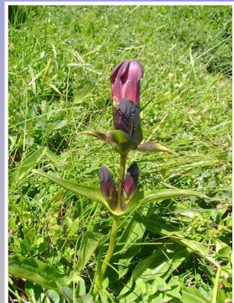
Gentiana purpurea - 14.07.10 - Corno alle Scale (circa m 1900 - Appennino Bolognese)

suddivisi in 5 - 8 lobi eretti di forma arrotondata e ottusa. Il calice è diviso da un lato sino alla base.