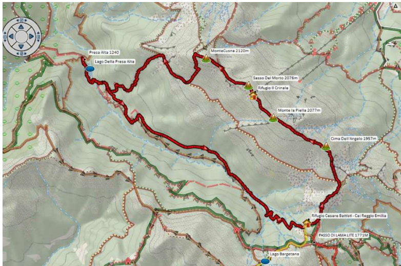
Percorso 2° giorno