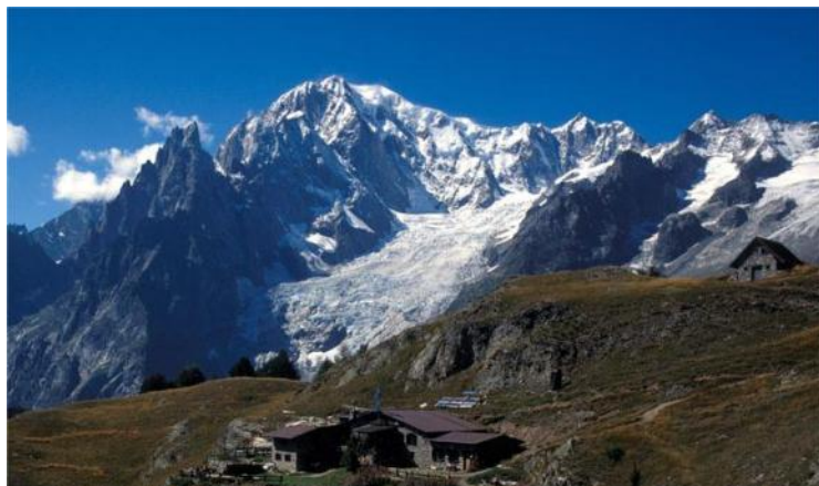
Mont de la Saxe Monte Bianco