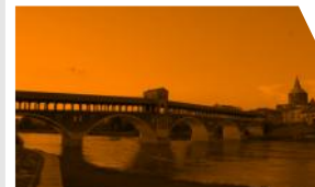
Pavia, Ponte Coperto