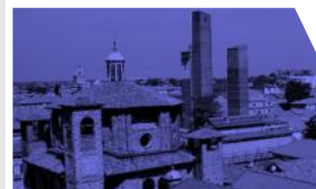
Pavia, le Torri