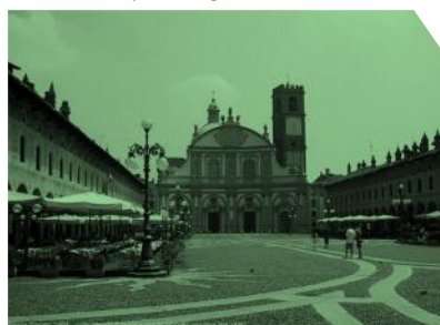
Vigevano la Piazza