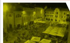
Pavia, la Piazza