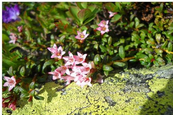
Loiseleuria procumbens - 03.07.10 - presso Lago della Vacca (circa m 2360 - Gruppo Adamello)

rasaliamo la strada costeggiandola sino ad una piccola discesa che conduce alle sottostanti e ben visibili baite di Nideralp 1815 m., attraversiamo in direzione di un ponticello che supera il torrente. Rimanendo sulla sinistra camminiamo verso un rado bosco che si estende sopra una marcata dorsale che risaliamo zigzagando nei punti più ripidi; quando la pendenza diminuisce un po' e si esce in spazi più aperti ci spostiamo sulla destra puntando all'evidente bastionata rocciosa di Hotosse. La si