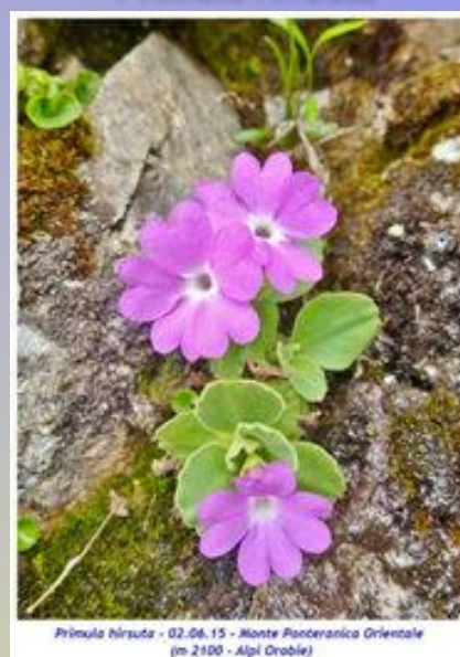
Primula hirsuta - 02.06.15 - Monte Pincenerica Orientale (m 2100 - Alpi Drobile)

denti lunghi quanto il tubo calcino. La corolla è formata da 5 petali di colore tra il rosso intenso e il violetto con fauce bianca. Sono presenti brattee membranose ovate, lunghe 1 – 3 mm.