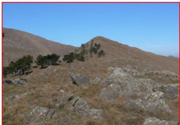
gruppo del Beigua.

Tra i vari percorsi proposti annualmente dalla marcia internazionale "Mare e Monti" di Arenzano, quello descritto nella presente scheda è forse uno dei più completi tra quelli proposti negli ultimi anni. La varietà di ambienti attraversati è un compendio di quello che il parco naturale del Beigua propone: dalle affollate spiagge della costa si passa rapidamente alle aree agresti immediatamente alle spalle dei centri abitati, fino a passare agli ambienti tipicamente montani caratteristici del